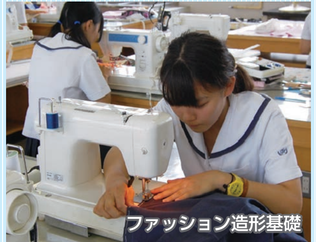
ファッション造形基礎